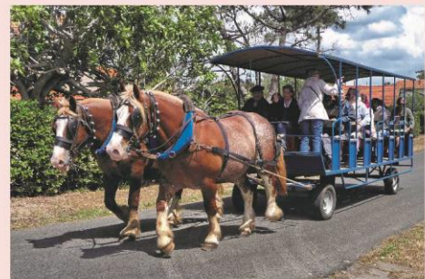
Balade en attelage