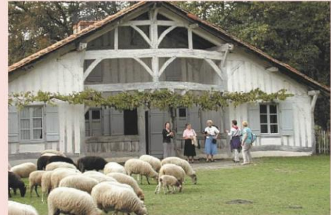
Ecomusée de Marquèze