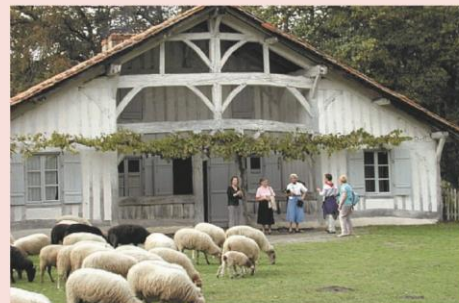
Ecomusée de Marquèze