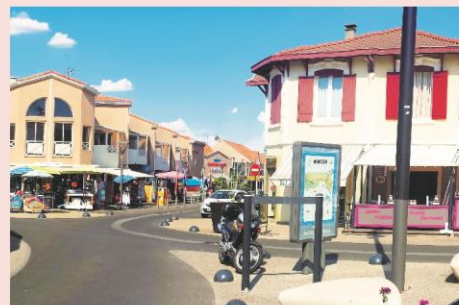
Centre ville de Mimizan Plage

Le programme d'activités est donné à titre indicatif et est susceptible d'être aménagé selon les conditions météorologiques ou la disponibilité du prestataire. Le programme détaillé sera transmis aux organisateurs au plus tard 7 jours avant le début du séjour. Piscine chauffée à disposition sur le centre et plage à 400 mètres, n'oubliez pas votre tenue de bain !