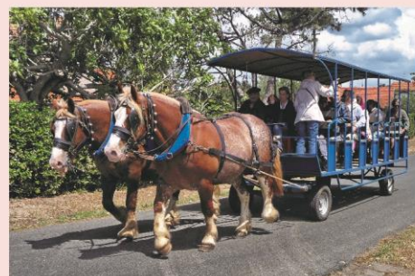
Balade en attelage