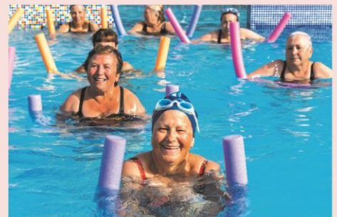
Remise en forme

Le programme d'activités est donné à titre indicatif et est susceptible d'être aménagé selon les conditions météorologiques ou la disponibilité du prestataire. Le programme détaillé sera transmis aux organisateurs au plus tard 7 jours avant le début du séjour. Espace aqualudique couvert et chauffé, n'oubliez pas votre tenue de bain !