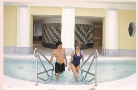
Thermes de Luz-Saint-Sauveur