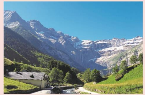
Le Cirque de Gavarnie

Petit-déjeuner. Retour vers la ville d'origine avec un panier repas à emporter.