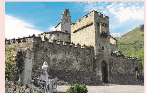
Eglise fortifiée de Luz-Saint-Sauveur