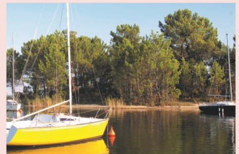
Le lac de Carcans

Le programme d'activités est donné à titre indicatif et est susceptible d'être aménagé selon les conditions météorologiques ou la disponibilité du prestataire. Le programme détaillé sera transmis aux organisateurs au plus tard 7 jours avant le début du séjour. Piscine chauffée à disposition sur le centre, plage du lac à 400 m et plages océanes à 7 km, n'oubliez pas votre tenue de bain!