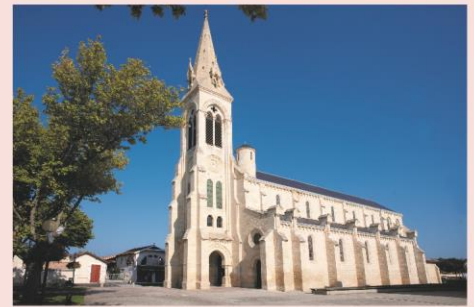
Eglise de Carcans

Petit déjeuner. Retour vers la ville d'origine avec un panier repas à emporter.