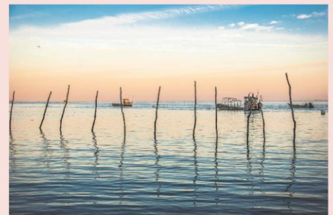
Cap Ferret, ostréiculture