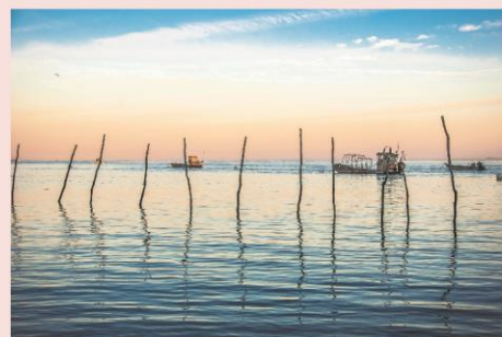
Cap Ferret, ostréiculture