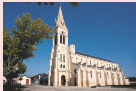
Eglise de Carcans

Petit déjeuner. Retour vers la ville d'origine avec un panier repas à emporter.