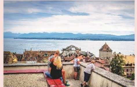
Nyon et son lac