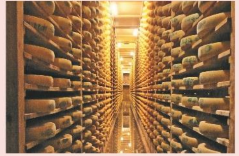
Fort des Rousses

Petit déjeuner. Retour vers la ville d'origine avec un panier repas à emporter.