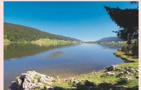
Le lac des Rousses

Le programme d'activités est donné à titre indicatif et est susceptible d'être aménagé selon les conditions météorologiques ou la disponibilité du prestataire. Le programme détaillé sera transmis aux organisateurs au plus tard 7 jours avant le début du séjour. Piscine chauffée à disposition, n'oubliez pas votre tenue de bain!