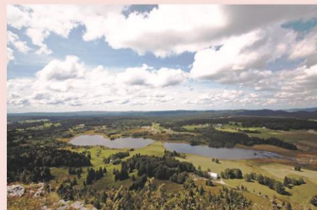
Le lac de Bellefontaine

Le programme d'activités est donné à titre indicatif et est susceptible d'être aménagé selon les conditions météorologiques ou la disponibilité du prestataire. Le programme détaillé sera transmis aux organisateurs au plus tard 7 jours avant le début du séjour. Piscine chauffée à disposition, n'oubliez pas votre tenue de bain!