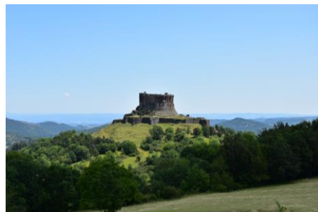
Château de Murol

Petit déjeuner. Retour vers la ville d'origine.