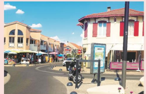
Centre ville de Mimizan Plage

Le programme d'activités est donné à titre indicatif et est susceptible d'être aménagé selon les conditions météorologiques ou la disponibilité du prestataire. Le programme détaillé sera transmis aux organisateurs au plus tard 7 jours avant le début du séjour. Piscine chauffée à disposition sur le centre et plage à 400 mètres, n'oubliez pas votre tenue de bain !