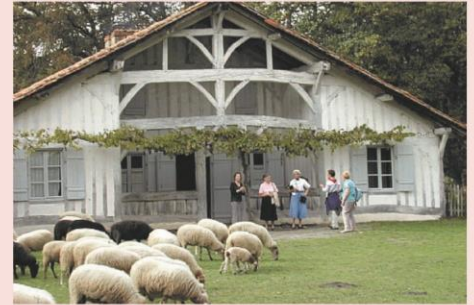
Ecomusée de Marquèze