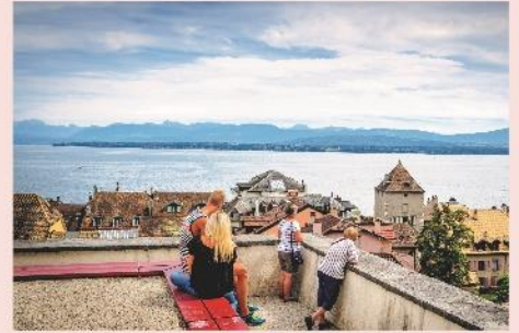
Nyon et son lac