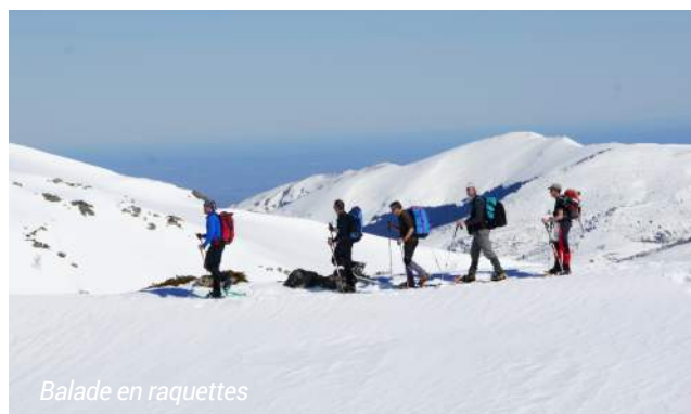
Balade en raquettes