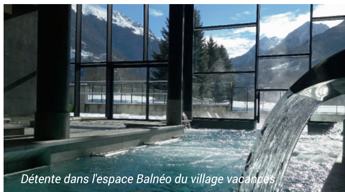
Détente dans l'espace Balnéo du village vacances

Les programmes d'activités sont donnés à titre indicatif et sont susceptibles d'être aménagés selon les conditions météorologiques ou la disponibilité du prestataire. Espace aquatique couvert et chauffé, n'oubliez pas votre tenue de bain !